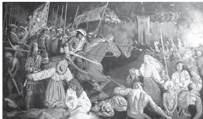
Упокорення й залякування. Батуринська трагедія стала прологом до цілковитої ліквідації української автономії у XVIII столітті

1667 рік. Московія і Річ Посполита укладають між собою сепаратне Андрусівське перемир'я. Територія Гетьманщини ділиться навпіл: Правобережжя відходить полякам, Лівобережжя (плюс Київ) — московитам. Позиція козацтва, їхньої старшини та гетьмана при цьо-