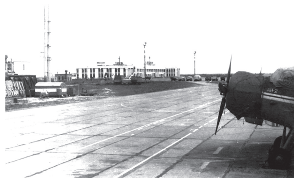
Аеропорт «Шестовиця». 1990 р. Чернігівський аеропорт біля селища Шестовиця був побудований в 1980-х роках. До 1994 року звідси відбувалися регулярні внутрішні рейси до Львова, Одеси, Донецька та Криму, а також міжнародні - в Москву, Тулу, Мінськ. Але за своїм прямим призначенням аеропорт не використовується вже 25 років.