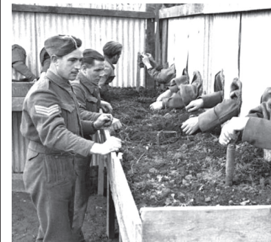
Британські сапери вчаться наосліп знешкоджувати міни, щоб могли робити це в темряві. 1943 рік.