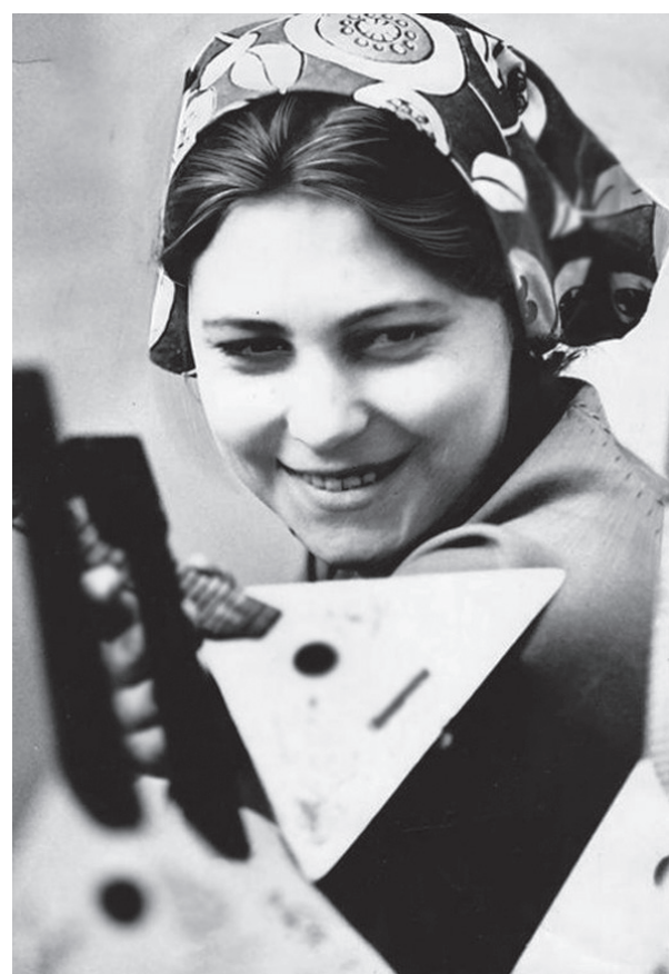
З історії Чернигівської фабрики музичних інструментів.