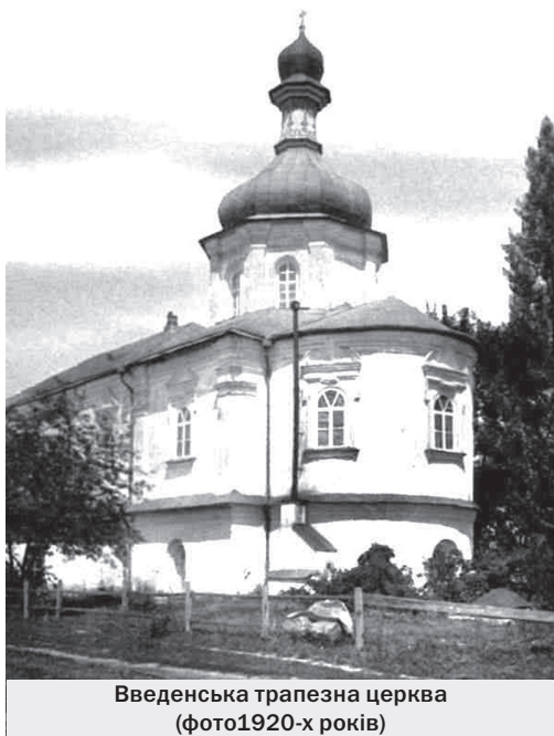
Введенська трапезна церква (фото 1920-х років)