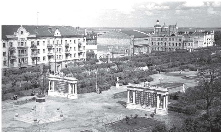
Такою була Аля героїв.