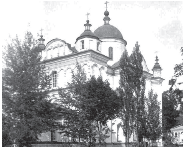
Загальний вигляд Спасо-Преображенського собору з південного заходу (фото кінця XIX століття)

Трапезна Введенська церква стояла на південний