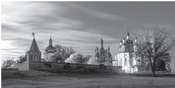
Фото пам'ятки з Чернігівщини перемогло у всеукраїнському конкурсі «Вікі любить пам'ятки 2019»

Учасники восьмого українського конкурсу подали майже 32 тисячі світлин 11-ти тисяч пам'яток нерухомої культурної спадщини України. Участь у ньому взяли понад 330 авторів. 2019 року Україна — перша у світі із 48 країн-учасниць за кількістю завантажених фото.