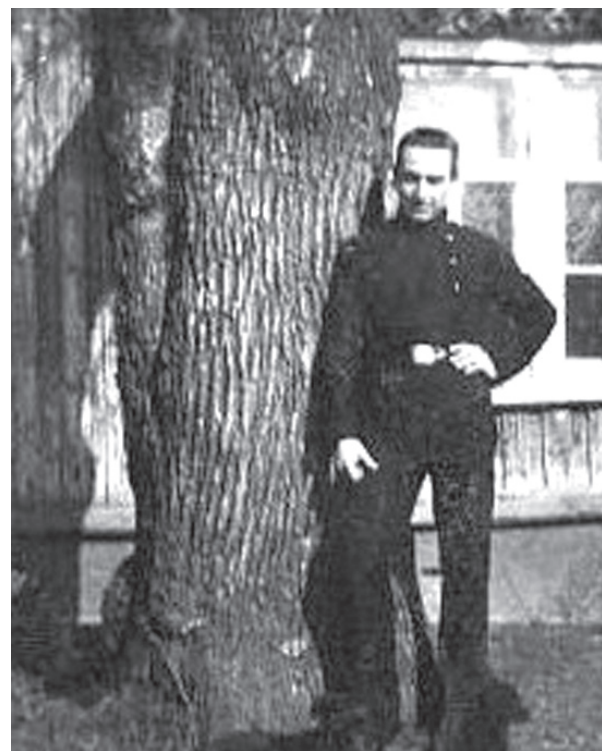
Гімназист. Поштовий штемпель від 14 квітня 1913 року. Чернігів.