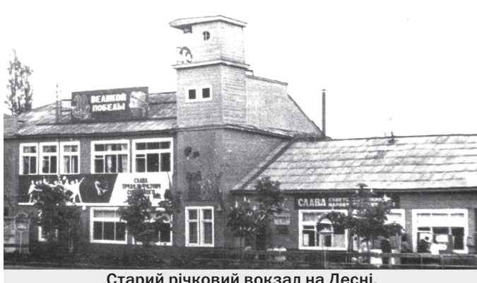
Старий річковий вокзал на Десні.

З історії Чернігова Фейсбук, сторінка Б. Атроценка