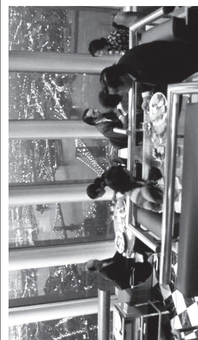
Вечеря у ресторані «Вікна у світ» Всесвітнього торгового центру (Північна вежа). Нью-Йорк, 1993 рік. Обидві ці вежі, разом з тисячами людей, будуть знищені при терористичному акті 11 вересня 2001 року, коли терористи, захопивши пасажирські літаки, спрямували їх на вежі.