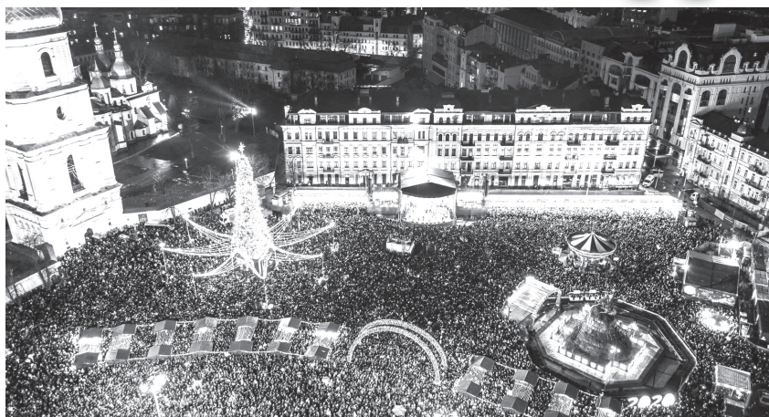
У новорічну ніч близько 100 тисяч киян і гостей столиці зустріли новий 2020 рік на Софійській площі Києва

Зверну увагу хоча б на два ювілеї нового року для України і українців. Перший — це 100-річчя поразки наших визвольних змагань, Української революції 1917 — 1920 років. Поразка — не свято, але ж ми відзначаємо подібне, і тут поняття «відзначаємо» не несе якогось сенсу святкування. Щороку 29 січня відзначаємо День пам'яті і вшанування героїв Крут, героїчну, але й трагічну сторінку нашої історії далекого 1918 року. Щороку 13 листопада — взагалі величезну трагедію, знищення військом Московії у 1708 році гетьманської столиці України Батурина, з тисячами його мешканців. А ще — Берестечко 1651 року, а ще... Та врешті, голо-